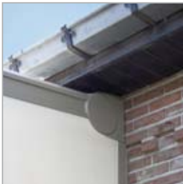
Perfekter Wandanschluss des integrierten Rooffix und Sidefix