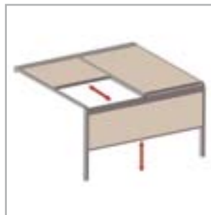
Lagune® + Frontfix = windfeste, verschließbare Vorderseite