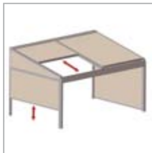
Lagune® + Sidefix = windfeste, verschließbare Seiten

(Anzahl der Tuchteile des Daches sind abhängig von der Breite der Lagune)