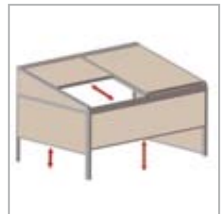
Lagune® + Frontfix + Sidefix = windfeste, verschließbare Vorderseite und Seiten