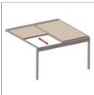
Lagune® = BASIS + Rooffix = Struktur + windfestes, wasserdichtes, lichtdurchlässiges Textilsonnenschutzdach

Die Terrassenüberdachung von RENSON® ist der einzige windfeste Textilsonnenschutz, der in die Basisstruktur integriert ist. Die Basisstruktur kann vollständig geschlossen werden wobei das Textilsonnenschutzdach wasserdicht, aber trotzdem lichtdurchlässig ist. Dank dieses innovativen Produktes haben Sie die Möglichkeit, mit maximalem Komfort nahezu das ganze Jahr lang draußen die Schönheit des Gartens zu genießen.